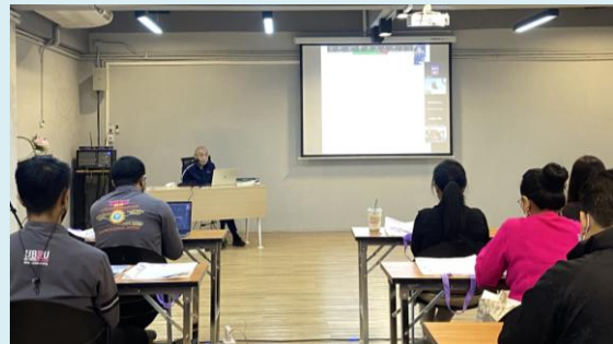
ภาพที่ 2 การบรรยายพิเศษ โดย ผู้บริหาร อพ.สธ.