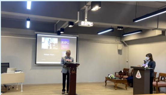
ภาพที่ 1 พิธีเปิดการฝึกอบรมปฏิบัติการฯ

สมาชิกฐานทรัพยากรท้องถิ่นเข้าร่วมฝึกอบรมฯ ผ่านสื่ออิเล็กทรอนิกส์ออนไลน์ โปรแกรม Zoom meeting ในการบันทึกข้อมูลลงระบบฐานข้อมูลทรัพยากร อพ.สธ. จำนวน 20 แห่ง