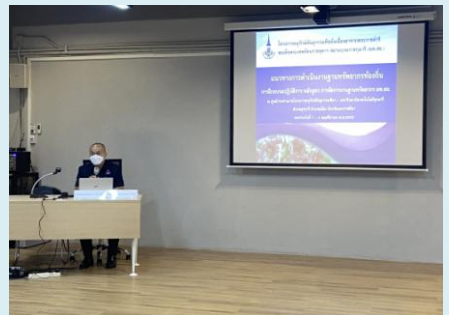
ภาพที่ 3 - 5 การบรรยายและนำปฏิบัติการโดย คณะวิทยากรจากบริษัทอินเทอร์เนตประเทศไทย จำกัด และเจ้าหน้าที่อพ.สธ.