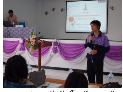
ภาพ ๓ ประชาสัมพันธ์โรงเรียนและสิ่ง อำนวยความสะดวก