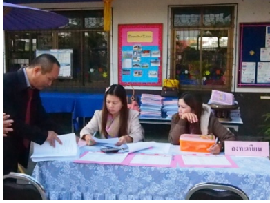
ภาพ ๑ ตรวจสอบเอกสาร ประกอบการประชุมกลุ่มสมาชิก