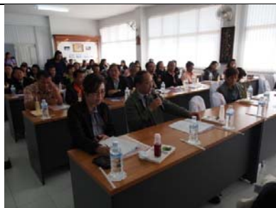
ภาพ ๑๑ โรงเรียนสมาชิกซักถามข้อ สงสัย