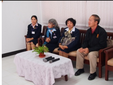
ภาพ ๕ คณะที่ปรึกษา ร่วมพิธีเปิดการ ประชุมกลุ่มสมาชิก