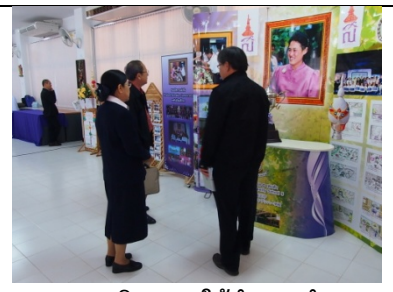
ภาพ ๑๒ วิทยากรให้คำแนะนำการ ดำเนินงานแก่โรงเรียนเจ้าภาพ