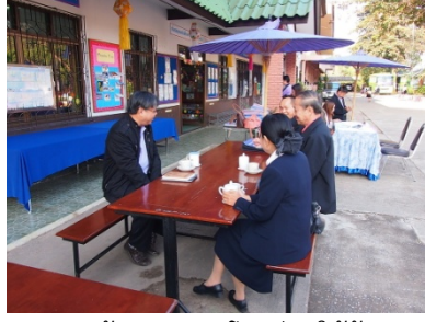
ภาพ ๒ ผู้อำนวยการโรงเรียนให้ข้อมูล ในการประชุมกลุ่มสมาชิกแก่คณะ วิทยากร