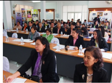
ภาพ ๖ โรงเรียนสมาชิกร่วมรับฟังการ บรรยายและคำแนะนำจากคณะ วิทยากร