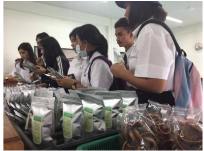
เรียนรู้พืชสมุนไพรในรูปแบบชาอินทรีย์