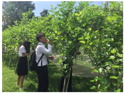
ชมลูกหม่อนและเรียนรู้เรื่องการขยายพันธุ์พืช