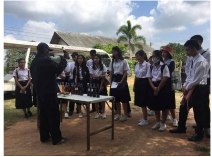
เรียนรู้การนำทรัพยากรพืชในท้องถิ่นมาแปรรูปเป็นปุ๋ยอินทรีย์