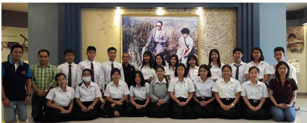
ถ่ายภาพหมู่เป็นที่ระลึก