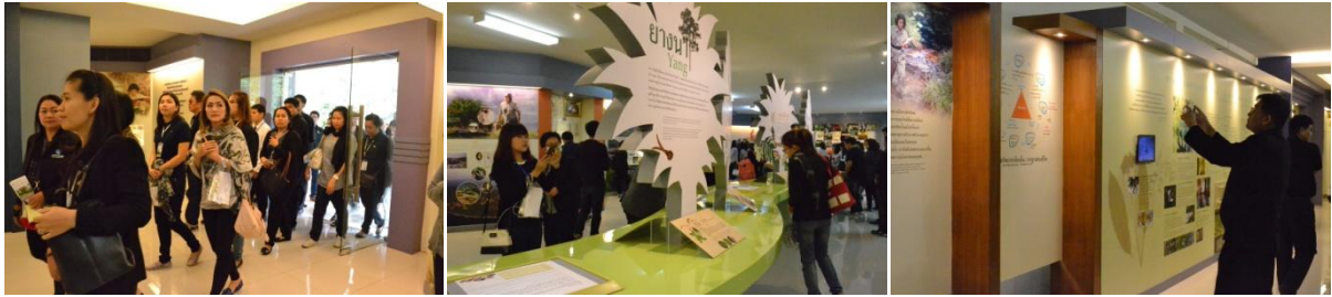
เยี่ยมชมพิพิธภัณฑ์ อพ.สธ.