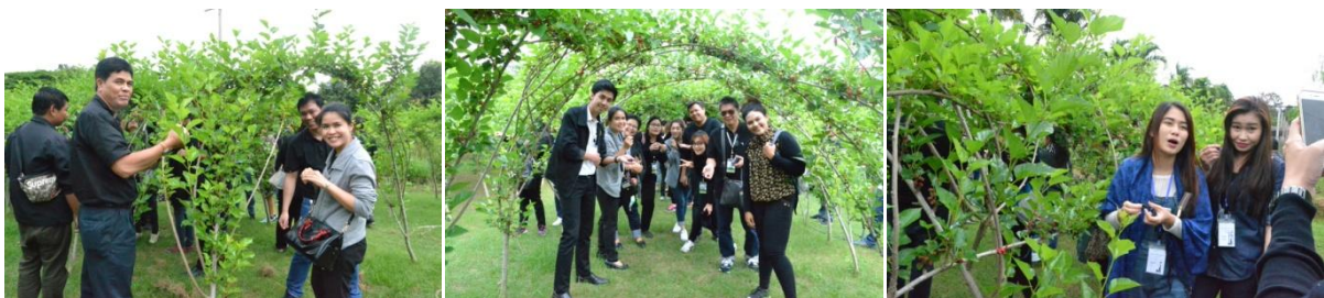
เยี่ยมชมแปลงหม่อนกินผลตลอดสารพืช