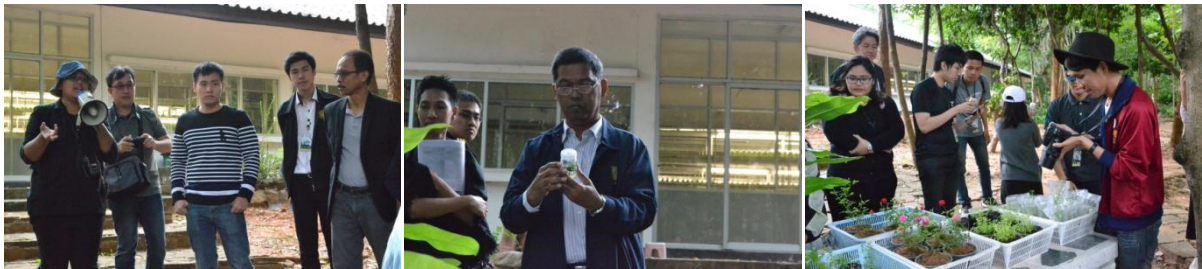
เยี่ยมชมหน่วยปฏิบัติการเพาะเลี้ยงเนื้อเยื่อพืช