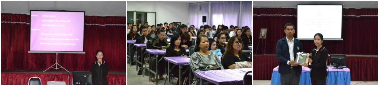
ฟังการบรรยายจากวิทยากรเกี่ยวกับประวัติความเป็นมาของศูนย์อนุรักษ์พันธุ์กรรมพืช อพ.สธ. คลองไผ่

เมื่อวันที่ 16 ธันวาคม 2559 สำนักงานปลัดสำนักนายกรัฐมนตรี โดยศูนย์บริการประชาชนในฐานะศูนย์รับเรื่องราวร้องทุกข์ของรัฐบาล ได้จัดทำโครงการสร้างความสัมพันธ์กับเครือข่ายผู้ปฏิบัติงานเรื่องราวร้องทุกข์ (Contact Point) ปีงบประมาณ 2560 ได้นำบุคลากรจากกระทรวง กรม หน่วยงานอิสระ รัฐวิสาหกิจ ศูนย์ดำรงธรรมจังหวัด และเจ้าหน้าที่ จำนวน 110 คน ซึ่งเป็นเครือข่ายผู้ปฏิบัติงาน ศึกษาดูงานภายในศูนย์อนุรักษ์พันธุ์กรรมพืช อพ.สธ. คลองไผ่ ตามที่โครงการดังกล่าวได้เล็งเห็นว่าคุณค่าของศูนย์อนุรักษ์พันธุ์กรรมพืช อพ.สธ. คลองไผ่ เป็นโครงการต้นแบบที่ส่งเสริมและสนับสนุนให้เกษตรกรและประชาชนตระหนักเห็นความสำคัญของการอนุรักษ์พันธุ์กรรมพืชและใช้ประโยชน์ในที่ดินทำกินอย่างรู้คุณค่า ตลอดจนสามารถดำเนินชีวิตตามแนวพระราชดำริเศรษฐกิจพอเพียง