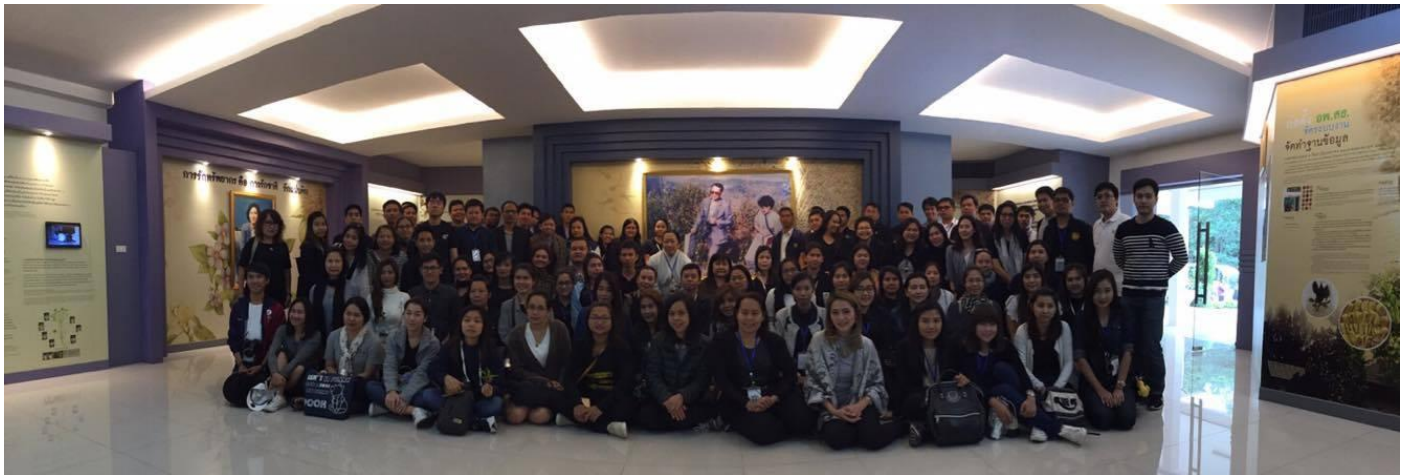
ถ่ายภาพเป็นที่ระลึกที่พิพิธภัณฑ์ อพ.สธ.