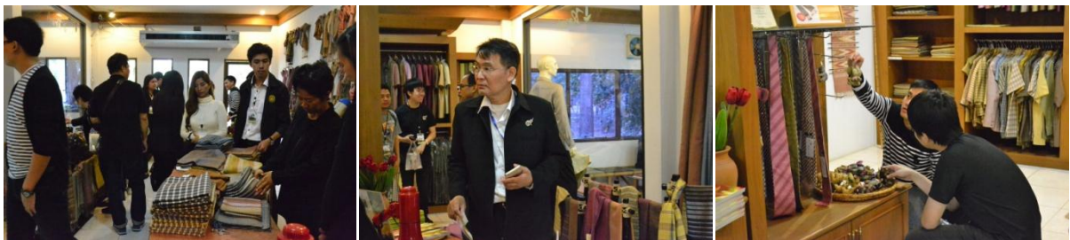
เยี่ยมชมและเลือกซื้อผลิตภัณฑ์ผ้าไหมย้อมสีธรรมชาติ