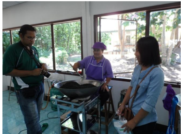
ชมสาธิตการผลิตชาใบหม่อน ชิมรสชาติชาชนิดต่างๆ พร้อมทั้งเลือกชมผลิตภัณฑ์ชา