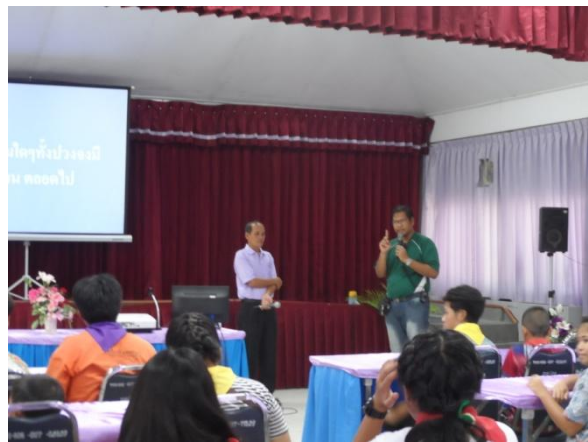
ฟังบรรยายความเป็นมาของศูนย์อนุรักษ์พันธุ์กรรมพืช อพ.สธ. คลองไผ่