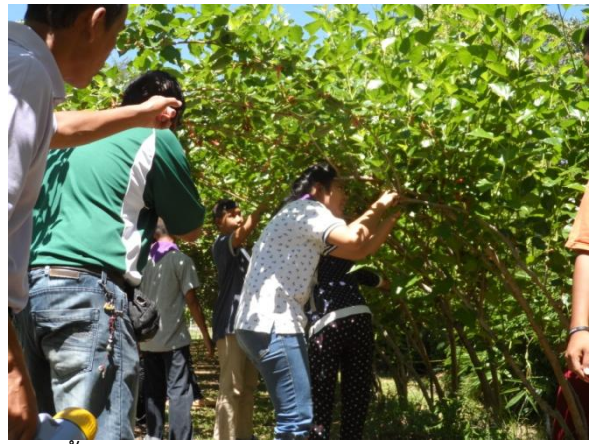
รู้จัก สัมผัส และชิมรสชาติผักพื้นเมืองชนิดต่างๆ