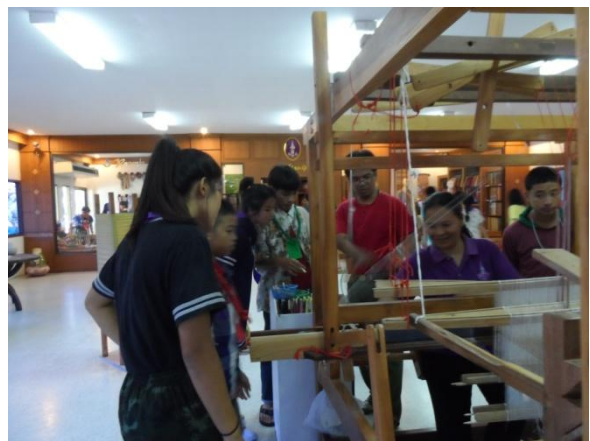
เยี่ยมชมนิทรรศการการย้อมเส้นไหมด้วยสีธรรมชาติ และชมสาธิตการทอผ้าด้วยกี่กระตุกแบบคันยก