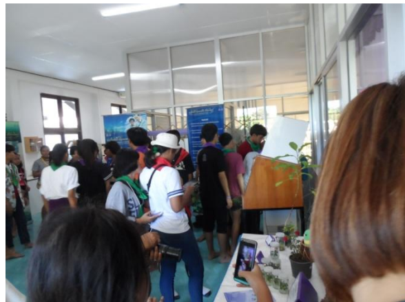
ศึกษาเรียนรู้เทคนิคการขยายพันธุ์พืชด้วยวิธีเพาะเลี้ยงเนื้อเยื่อ