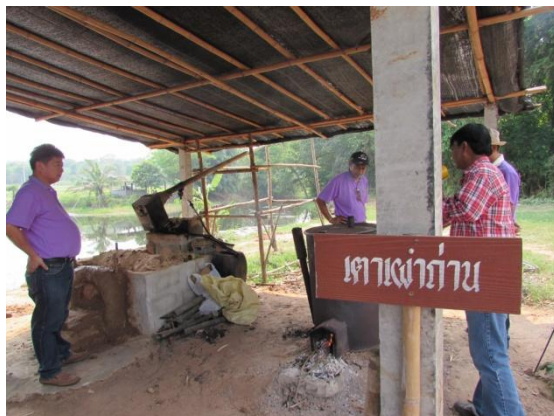
ชมคอกสัตว์เลี้ยงเพื่อนำมูลมาใช้ในการผลิตปุ๋ยหมักชีวภาพ และชมการผลิตน้ำส้มควันไม้