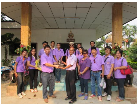
เลือกซื้อพรรณไม้ดอกไม้ประดับ พืชผักพื้นเมือง พืชสมุนไพร และมอบของที่ระลึก