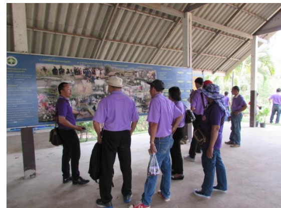
เรียนรู้วิธีการผลิตปุ๋ยหมักชีวภาพ