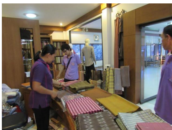
ศึกษาเรียนรู้กระบวนการการย้อมเส้นไหมด้วยสีธรรมชาติ และเลือกชมผลิตภัณฑ์ผ้าไหมย้อมสีธรรมชาติ