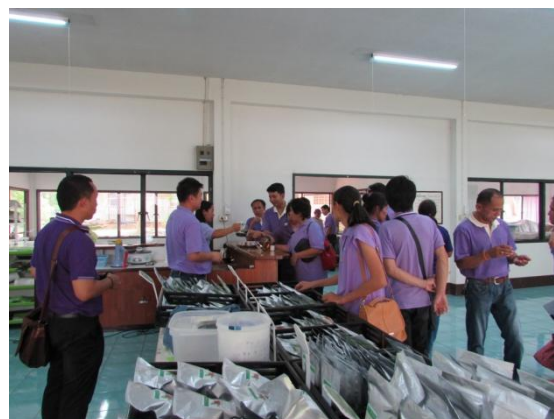
เรียนรู้วิธีการผลิตชาเขียวใบหม่อน ชิมรสชาตีสวนชนิดต่างๆ และเลือกซื้อผลิตภัณฑ์ชา