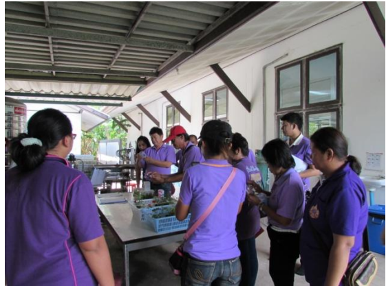
ศึกษาวิธีการขยายพันธุ์พืชด้วยการเพาะเลี้ยงเนื้อเยื่อ และเลือกสนับสนุนพรรณไม้ที่ได้จากการเพาะเลี้ยงเนื้อเยื่อ