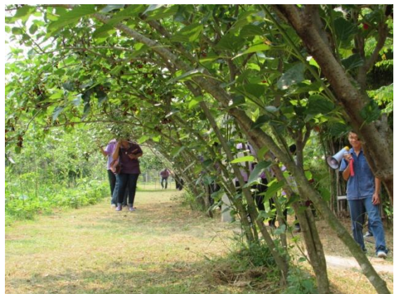
เรียนรู้และสัมผัสกับผักพื้นเมืองของไทยหลากหลายชนิด