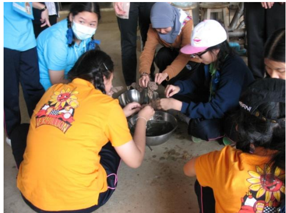
เรียนรู้การทำผ้ามัดย้อมจากสีธรรมชาติ โดยใช้ส่วนของเปลือกต้นสะเดาในการทำสีย้อม