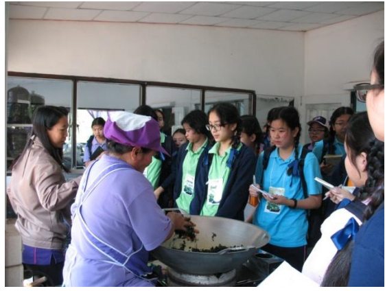
ศึกษาวิธีการและเทคนิคในการผลิตชาอินทรีย์