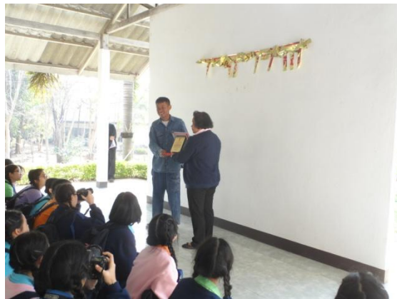
คณะนักเรียนเตรียมพร้อมสำหรับทำกิจกรรม