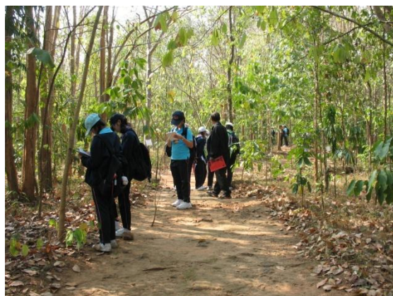
ศึกษาเรียนรู้เกี่ยวกับชนิดของป่า และความหลากหลายทรัพยากรกายภาพและชีวภาพที่อยู่ในป่า