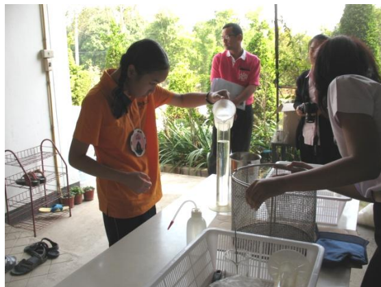
ศึกษาวิธีการขยายพันธุ์พืชด้วยการเพาะเลี้ยงเนื้อเยื่อ และแบ่งกลุ่มเตรียมอาหารเลี้ยงเนื้อเยื่อ