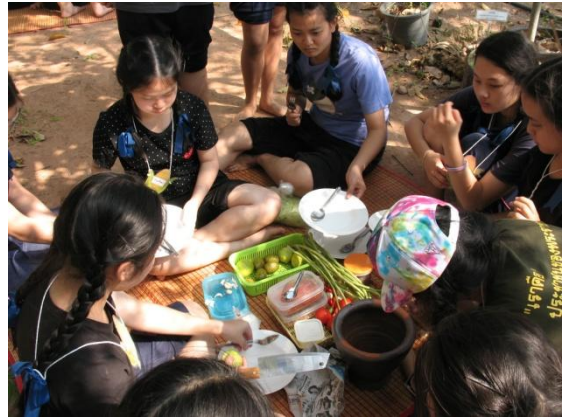
เรียนรู้วิธีการถอนกล้า-ดำนาข้าว และการกินอยู่แบบวิถีชาวบ้าน