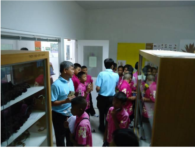
เรียนรู้ภายในห้องพิพิธภัณฑ์พืช อพ.สธ.