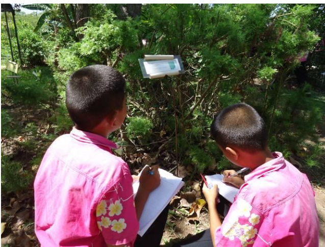
รู้จักผักพื้นเมืองของไทย