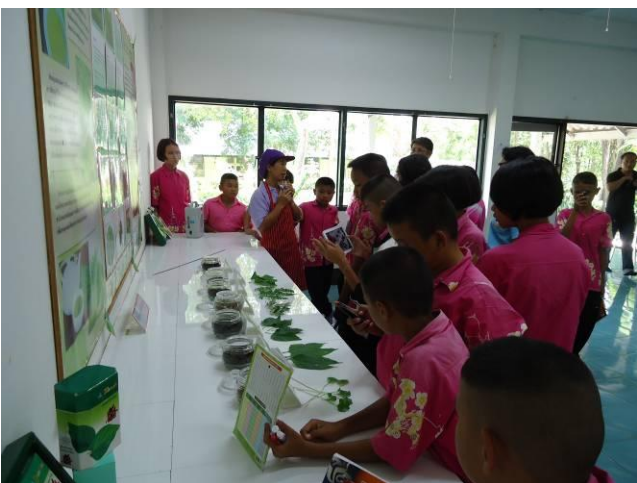
เรียนรู้และทดลองทำชาอินทรีย์