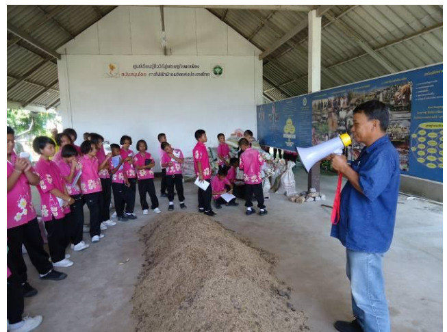
เรียนรู้วิธีการทำปุ๋ยอินทรีย์