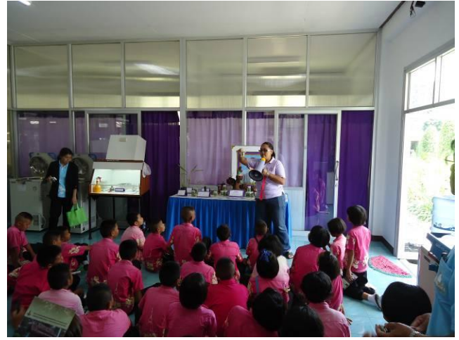
เรียนรู้การเพาะเลี้ยงเนื้อเยื่อพืช