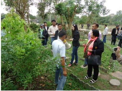
ชมผักพื้นเมืองในสวน