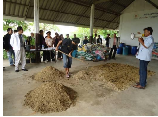
ชมการสาธิตการทำปุ๋ยอินทรีย์