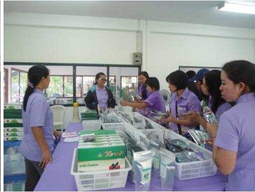
ภาพที่ ๓ เรียนรู้การผลิตชาอินทรีย์ ชิมและเลือกผลิตภัณฑ์ชาอินทรีย์ชนิดต่างๆ