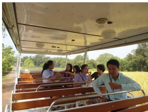
ภาพที่ ๕ บรรยากาศการศึกษาดูงานโดยนั่งรถนำชมไปตามจุดเรียนรู้ต่างๆ