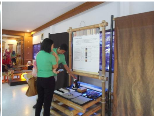
ภาพที่ ๔ เรียนรู้การพัฒนาสีข้อมเส้นไหมและฝ้ายด้วยพืชชนิดต่างๆ และชมสาธิตการทอผ้าด้วยกี่กระตุก