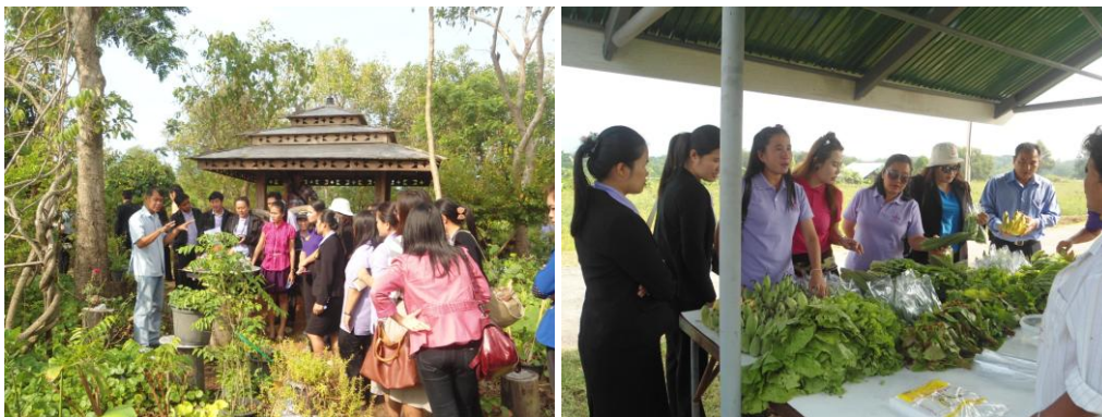
ภาพที่ ๒ รู้จักผักพื้นเมืองของไทยชนิดต่างๆ และเลือกซื้อผักสดซึ่งปลูกในระบบเกษตรอินทรีย์