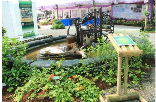
บรรยากาศบริเวณบูธจัดแสดงนิทรรศการ