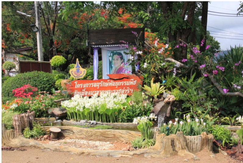
ป้ายโครงการอนุรักษ์พันธุกรรมพืชฯ ประดับตกแต่งด้วยพรรณไม้ดอกไม้ประดับนานาชนิด

ระหว่างวันที่ ๑-๑๐ พฤษภาคม ๒๕๕๕ ศูนย์อนุรักษ์พันธุกรรมพืช อพ.สธ. คลองไผ่ ร่วมจัดบูธแสดงนิทรรศการในงานวันเกษตรแห่งชาติ ประจำปี ๒๕๕๕ ณ ศูนย์วิจัย สาขิตและฝึกอบรมการเกษตรแม่เหียะ คณะเกษตรศาสตร์ มหาวิทยาลัยเชียงใหม่ เพื่อเผยแพร่ประชาสัมพันธ์โครงการอพ.สธ. และการดำเนินงานในพื้นที่ศูนย์อนุรักษ์พันธุกรรมพืช อพ.สธ. คลองไผ่ นอกจากนี้ยังจัดกิจกรรมการประดิษฐ์สิ่งต่างๆ จากชิ้นส่วนของพืชไว้สำหรับนักเรียน นักศึกษา เยาวชน ได้เข้าร่วมสนุกด้วย โดยได้รับความสนใจจากผู้เข้าชมบูธเป็นจำนวนมาก