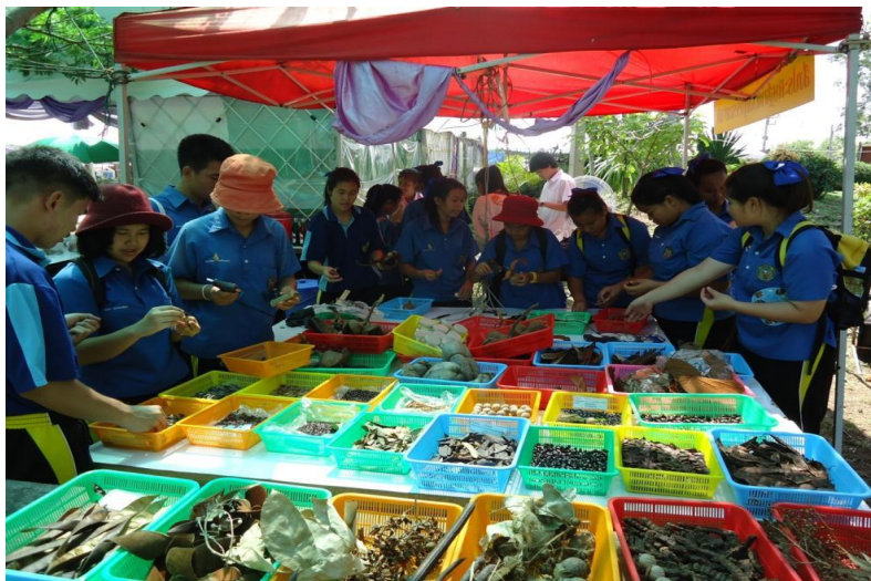
กิจกรรมการประดิษฐ์ตุ๊กตา สัตว์ หรือสิ่งของ จากส่วนต่างๆ ของฟเหิง ตามจินตนาการ