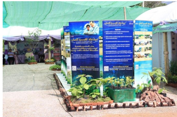
ภาพรวมการจัดบูธนิทรรศการ