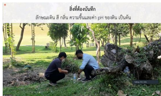
ภาพที่ 6 สาธิต การวิเคราะห์สภาพภูมิศาสตร์ พื้นที่ปลูกรักษาทรัพยากรท้องถิ่น โดย วิทยากร ศูนย์แม่ข่ายประสานงานฯ-มช.