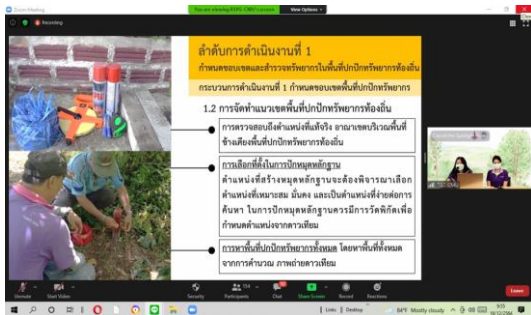
ภาพที่ 3 บรรยาย งานปักปักทรัพยากรท้องถิ่น โดย วิทยากร ศูนย์แม่ข่ายประสานงานฯ - มช.