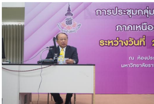
ภาพที่ 1 อธิการบดีมหาวิทยาลัยราชภัฏเชียงใหม่ “ประธานพิธีเปิด การประชุมกลุ่มสมาชิกฯ”

ศูนย์ประสานงานโครงการอนุรักษ์พันธุกรรมพืชอันเนื่องมาจากพระราชดำริฯ มหาวิทยาลัยราชภัฏเชียงใหม่ (อพ.สธ.-มรภ.ชม) ได้จัดประชุมกลุ่มสมาชิกฐานทรัพยากรท้องถิ่น ภาคเหนือตอนบน ครั้งที่ 1/2563 ระหว่างวันที่ 23 - 24 มกราคม พ.ศ. 2562 ณ ห้องประชุม ชั้น 15 อาคารราชภัฏ 90 ปี มหาวิทยาลัยราชภัฏเชียงใหม่ ให้กับสมาชิกฐานทรัพยากรท้องถิ่น ภาคเหนือตอนบน โดยมีผู้เข้าร่วมการประชุมกลุ่มสมาชิกฐานทรัพยากรท้องถิ่น จำนวน 67 แห่ง 147 คน