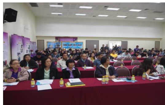
ภาพที่ 2 สมาชิกฐานทรัพยากรท้องถิ่นร่วมพิธีเปิด “การประชุมกลุ่มสมาชิกฯ”