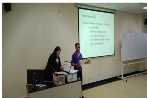
ภาพที่ 3 วิทยากร องค์การบริหารส่วนตำบลบ้านกาต บรรยาย “การวิเคราะห์สภาพภูมิศาสตร์พื้นที่”