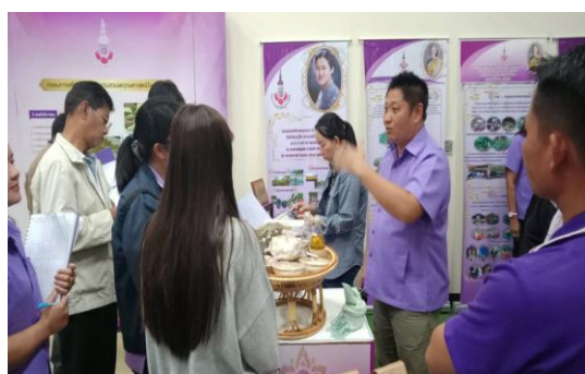
ภาพที่ 6 นิทรรศการ องค์การบริหารส่วนตำบลบ้านกาต “ปลัด อบต.บ้านกาต บรรยาย นิทรรศการ”