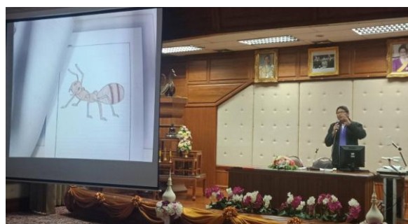
ภาพที่ 6 นำเสนอผลปฏิบัติการ “การเก็บข้อมูลการใช้ประโยชน์ของสัตว์ในท้องถิ่น”