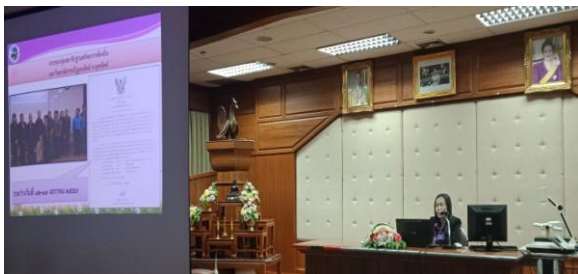
ภาพที่ 3 วิทยากร อบต.ปางตาไว บรรยาย “การบริหารและการจัดการ”