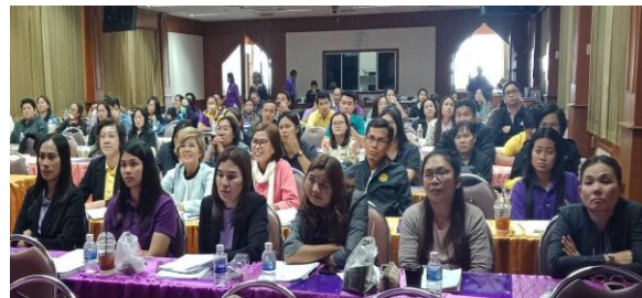
ภาพที่ 2 สมาชิกร่วมพิธีเปิด “การประชุมกลุ่มสมาชิกฐานทรัพยากรท้องถิ่น”