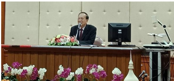
ภาพที่ 1 อธิการบดีมหาวิทยาลัยราชภัฏอุดรดิตถ์ “ประธานพิธีเปิดการประชุมกลุ่มสมาชิกฯ”

ศูนย์ประสานงานโครงการอนุรักษ์พันธุกรรมพืชอันเนื่องมาจากพระราชดำริฯ มหาวิทยาลัยราชภัฏอุดรดิตถ์ (อพ.สธ. – มรภ.อุดรดิตถ์) ได้จัดประชุมกลุ่มสมาชิกฐานทรัพยากรท้องถิ่น หลักสูตรการบริหารและการจัดการ งานที่ 1 งานปกป้องทรัพยากรท้องถิ่น งานที่ 2 งานสำรวจเก็บรวบรวมทรัพยากรท้องถิ่น ระหว่างวันที่ 19-20 ธันวาคม พ.ศ.2562 ณ ห้องประชุมสิริราชภัฏ ชั้น 9 อาคารภูมิราชภัฏ มหาวิทยาลัยราชภัฏอุดรดิตถ์ ให้กับสมาชิกฐานทรัพยากรท้องถิ่น ภาคเหนือตอนล่าง โดยมีผู้เข้าร่วมการประชุมกลุ่มสมาชิกฐานทรัพยากรท้องถิ่น จำนวน 20 แห่ง 76 คน