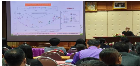
ภาพที่ 4 วิทยากร อบต.ปางตาไว บรรยาย “การกำหนดขอบเขตพื้นที่ปกป้องทรัพยากรท้องถิ่น”