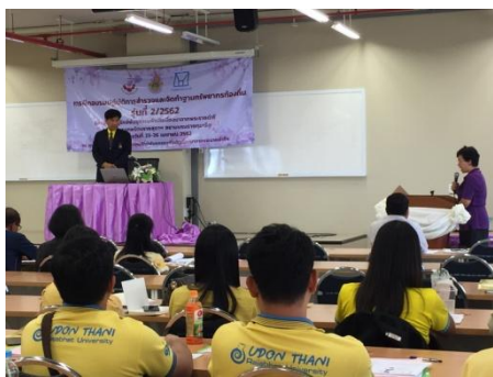
ภาพที่ 1 พิธีเปิด การฝึกอบรมปฏิบัติการฯ