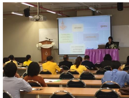
ภาพที่ 2 การบรรยายพิเศษ โดย อพ.สธ.