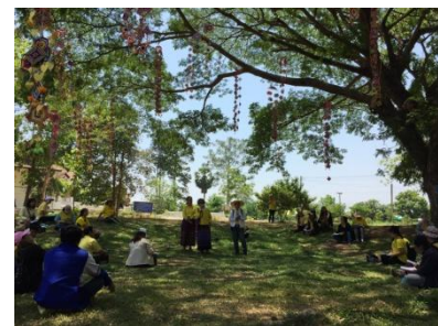
ภาพที่ 3 - 5 ผู้เข้าฝึกอบรมฯ ร่วมสำรวจเก็บรวบรวมข้อมูลสู่การขึ้นทะเบียนทรัพยากรท้องถิ่น