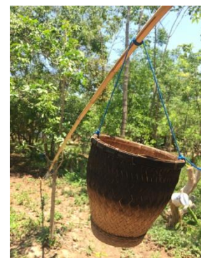
ภาพที่ 6 - 9 ทรัพยากรพืช โบราณสถาน โบราณวัตถุ และภูมิปัญญาท้องถิ่นตำบลโคกสี จังหวัดขอนแก่น