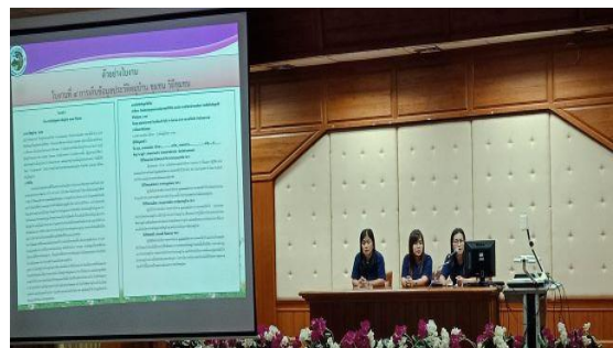
ภาพที่ 3 - 4 วิทยากร อพ.สธ.และองค์การบริหารส่วนตำบลปางตาไว บรรยายแนวทางการดำเนินงานฐานทรัพยากรท้องถิ่น