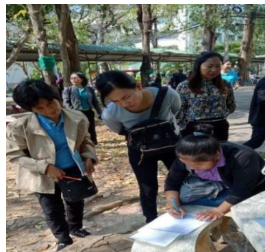
ภาพที่ 5 - 6 ปฏิบัติการกลุ่ม โดยผู้เข้าร่วมการประชุมกลุ่มสมาชิกฐานทรัพยากรท้องถิ่น