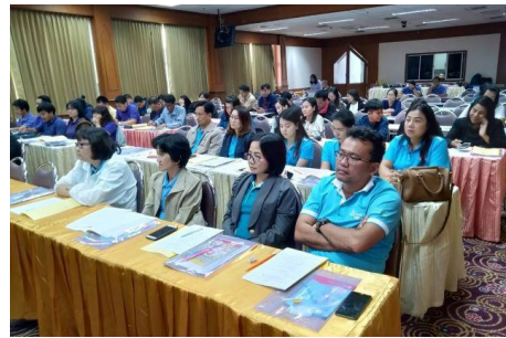
ภาพที่ 1 - 2 ผู้บริหารศูนย์ประสานงาน อพ.สธ.-มรภ.อุดรดิตถ์ ร่วมพิธีเปิดการประชุมกลุ่มสมาชิกฐานทรัพยากรท้องถิ่น