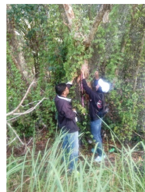
ภาพที่ 5 – 8 ผู้เข้ารับการฝึกอบรมฯ เรียนรู้ 4 ทรัพยากร โดยการลงมือปฏิบัติ หลังจากรับฟังแนวทางในการเรียนรู้จากวิทยากร