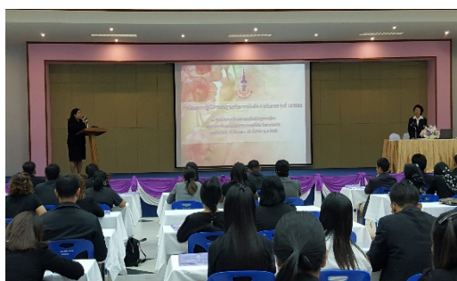
ภาพที่ 1 พิธีเปิดการฝึกอบรมปฏิบัติการ รุ่นที่ 13/2560

โครงการอนุรักษ์พันธุกรรมพืชอันเนื่องมาจากพระราชดำริ สมเด็จพระเทพรัตนราชสุดาฯ สยามบรมราชกุมารี (อพ.สธ.) ร่วมกับมหาวิทยาลัยเทคโนโลยีราชมงคลศรีวิชัย วิทยาเขตตรัง อำเภอสิเกา จังหวัดตรัง ได้จัดฝึกอบรมปฏิบัติการฐานทรัพยากรท้องถิ่น 4 ทรัพยากร รุ่นที่ 13/2560 ระหว่าง วันที่ 28 – 31 มีนาคม พ.ศ.2560 โดยมีองค์กรปกครองส่วนท้องถิ่น ที่ได้รับป้ายสนองพระราชดำรินงานฐานทรัพยากรท้องถิ่น เข้าร่วมการฝึกอบรม ในครั้งนี้ จำนวน 9 แห่ง สถานศึกษาที่ร่วมดำเนินงานฐานทรัพยากรท้องถิ่นจำนวน 14 แห่ง รวมผู้เข้ารับการฝึกอบรมทั้งสิ้น จำนวน 77 คน