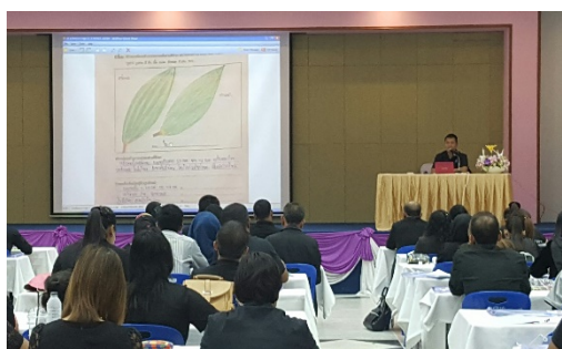
ภาพที่ 3 วิทยากรบรรยายแนวทางการเรียนรู้ 4 ทรัพยากร