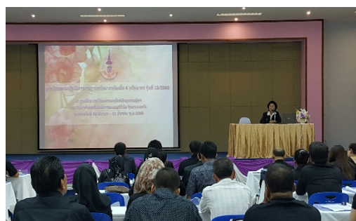
ภาพที่ 2 ประธานบรรยายต้อนรับผู้เข้ารับการฝึกอบรมฯ