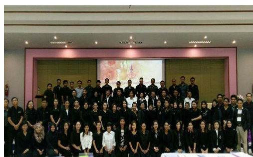
ภาพที่ 4 ภาพรวมผู้เข้ารับการฝึกอบรมฯ รุ่นที่ 13/2560