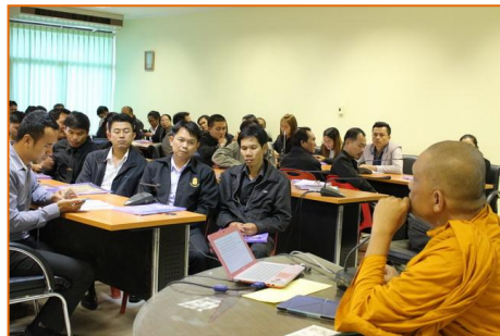
ที่ปรึกษาประสานงาน อพ.สธ. พระครูบริหารคณาทร ให้ข้อคิดในการใช้ อนุรักษ์ และพัฒนาทรัพยากร