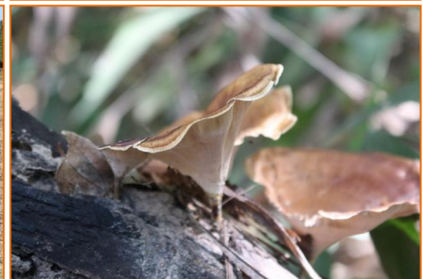
การสำรวจ เก็บข้อมูล การใช้ประโยชน์พืช สัตว์ และชีวภาพอื่นๆในท้องถิ่น