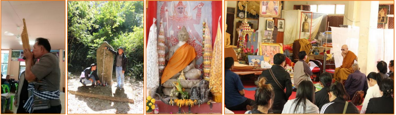
การสำรวจ เก็บข้อมูล แหล่งโบราณคดี และภูมิปัญญาในท้องถิ่น