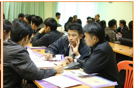
ผู้เข้ารับการฝึกอบรมทำปฏิบัติการ ความเชื่อมโยง สอดคล้อง บูรณาการกับยุทธศาสตร์