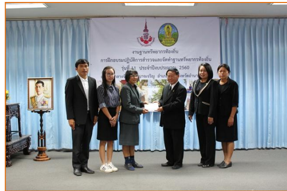
พิธีมอบเกียรติบัตรและปิดการฝึกอบรม