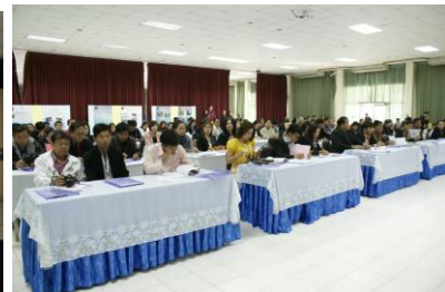
ภาพที่ ๑ - ๓ พิธีเปิดการฝึกอบรมปฏิบัติการ สสำรวจและจัดทำฐานทรัพยากรท้องถิ่น รุ่นที่ ๖/๒๕๕๙