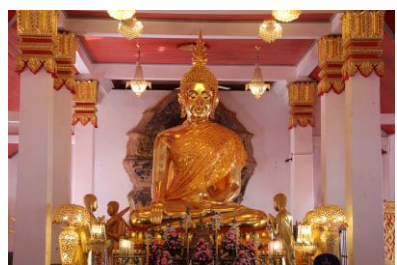
ภาพที่ ๑๓ - ๑๕ การเก็บข้อมูลวัดพระธาตุเชิงชุมวรวิหาร อำเภอเมือง จังหวัดสกลนคร