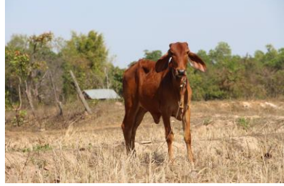
ภาพที่ ๗ - ๙ การเก็บข้อมูลการใช้ประโยชน์จากสัตว์ในท้องถิ่น กลุ่มธนาคารโคกระบือบ้านโนนพอก อำเภอพรรณานิคม จังหวัดสกลนคร