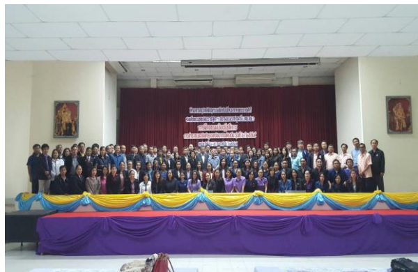
ภาพที่ ๑๖ - ๑๗ พิธีเปิดการฝึกอบรมปฏิบัติการ สำรวจและจัดทำฐานทรัพยากรท้องถิ่น รุ่นที่ ๖/๒๕๕๙