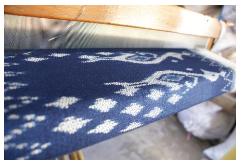
ภาพที่ ๔ - ๖ การเก็บข้อมูลการใช้ประโยชน์จากพืชคราม บ้านโนนเรือ อำเภอนิคมน้ำจืด จังหวัดสกลนคร