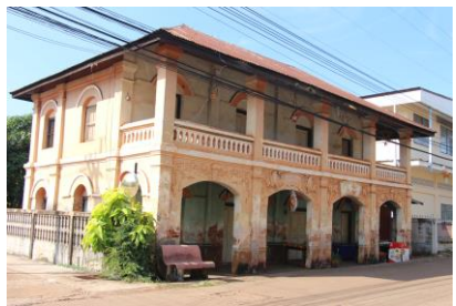
ภาพที่ ๑๐ - ๑๒ การเก็บข้อมูลโบสถ์คริสต์(อาสนวิหารอัครเทวดามีคาแอลท่าแร่) และคฤหาสน์โบราณ หมู่บ้านท่าแร่ อำเภอท่าแร่ จังหวัดสกลนคร