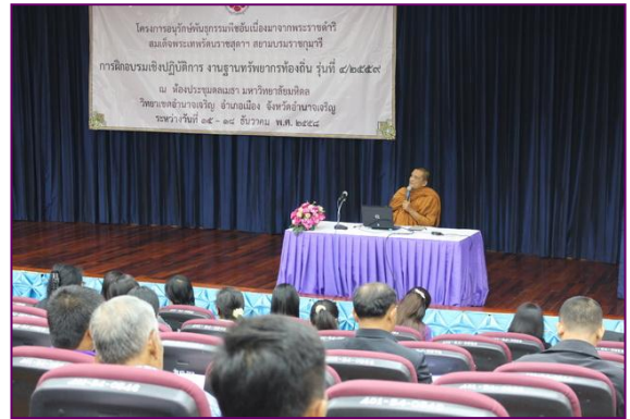
บรรยายพิเศษ โดยพระบริหารคณาทร