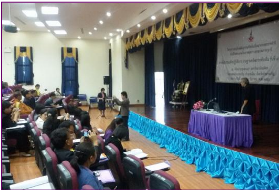
เปิดการฝึกอบรม โดยรองผู้อำนวยการโครงการอนุรักษ์พันธุกรรมพืชอันเนื่องมาจากพระราชดำริฯ (อพ.สธ.) นายพรชัย จุฑามาศ

โครงการอนุรักษ์พันธุกรรมพืชอันเนื่องมาจากพระราชดำริ สมเด็จพระเทพรัตนราชสุดาฯ สยามบรมราชกุมารี (อพ.สธ.) ได้จัดฝึกอบรมปฏิบัติการสำรวจและจัดทำฐานทรัพยากรท้องถิ่น รุ่นที่ 4/2559 ระหว่างวันที่ 15 – 18 ธันวาคม 2558 ณ ห้องประชุมตลเมธา โครงการจัดตั้งมหาวิทยาลัยมหิดล วิทยาเขตอำนาจเจริญ อำเภอเมือง จังหวัดอำนาจเจริญ สำหรับองค์กรปกครองส่วนท้องถิ่น และสมาชิกสวนพฤกษศาสตร์โรงเรียนในจังหวัดอำนาจเจริญ โดยใช้แหล่งเรียนรู้ในพื้นที่ของตำบลไถ่คำ อำเภอเมือง จังหวัดอำนาจเจริญ มีผู้เข้ารับการอบรมจำนวน 42 หน่วยงาน 81 คน