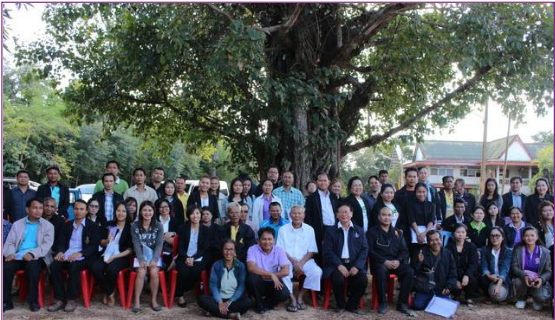
เรียนรู้ทรัพยากรธรรมชาติและโบราณคดีในท้องถิ่น