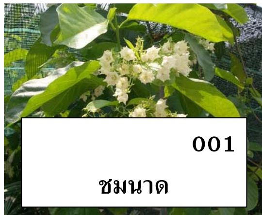
ป้ายชื่อพรรณไม้ชั่วคราว มีหมายเลขรหัส และชื่อพื้นเมือง

1. ป้ายชื่อพรรณไม้ชั่วคราว เป็นสื่อการเรียนรู้ขั้นต้น ประกอบด้วย : หมายเลขรหัสพรรณไม้ (เฉพาะ 3 ตัวสุดท้าย) ชื่อพื้นเมือง (ชื่อที่เรียกกันในท้องถิ่นนั้นๆ) นอกจากนี้ยังอาจมีข้อมูลการใช้ประโยชน์ (อาจจะได้จากการศึกษาเอกสารอ้างอิง จากประสบการณ์ หรือสอบถามผู้รู้)