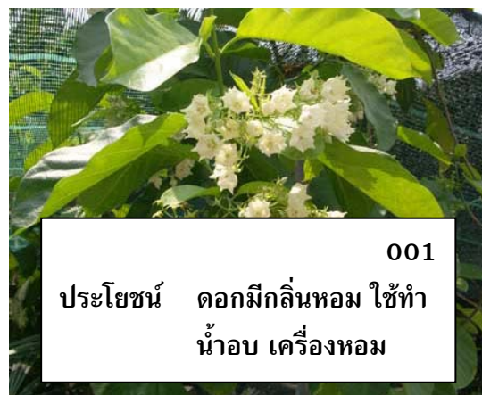
ป้ายชื่อพรรณไม้ชั่วคราว มีหมายเลขรหัส ชื่อพื้นเมือง และประโยชน์