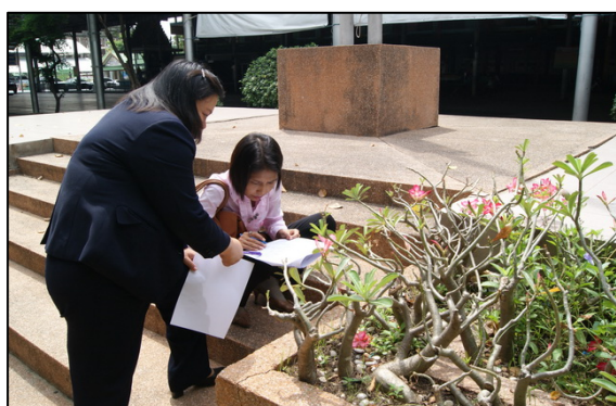
บรรยากาศการปฏิบัติการศึกษาพรรณไม้ โดยใช้เอกสาร ก.๗-๐๐๓