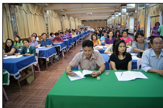
บรรยากาศในห้องประชุม