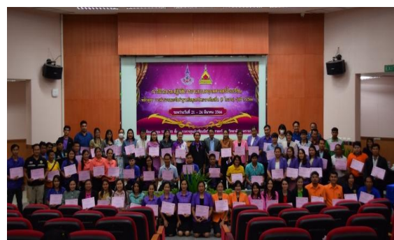
ภาพที่ 6 ผู้เข้ารับการฝึกอบรมปฏิบัติการฯ รับเกียรติบัตร