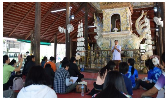
ภาพที่ 4 ใบบางที่ 9 ธรรมมาสสังข์เทินบุศบก พื้นที่หมู่บ้านชีทวน (วัดศรีนวลสว่างอารมณ์ อำเภอเข็ญ จังหวัดอุบลราชธานี)