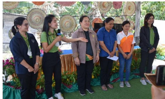
ภาพที่ 2 วิทยากร อบต.โนนโพนน ใบบาง 5 - 7 ตำบลโนนโพน อำเภวารินชำราบ จังหวัดอุบลราชธานี