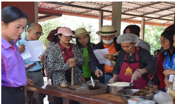
ภาพที่ 3 ใบบางที่ 8 ภูมิปัญญาในการทำข้าวตอกลิ้ม พื้นที่หมู่บ้านชีทวน (วัดศรีนวลสว่างอารมณ์ อำเภอเข็ญ จังหวัดอุบลราชธานี)