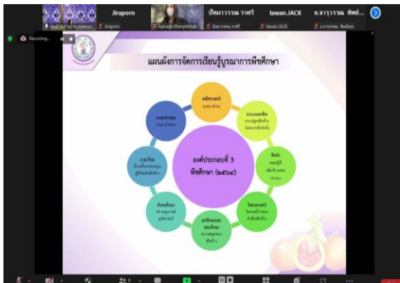
ภาพที่ 3 นำเสนอด้านที่ 2 การดำเนินงาน และด้านที่ 3 ผลการดำเนินงาน ครู-อาจารย์โรงเรียนช้างมิ่งพิทยานุกูล