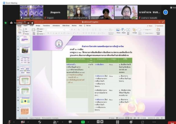
ภาพที่ 2 นำเสนอด้านที่ 1 การบริหารและการจัดการ ผู้อำนวยการโรงเรียนช้างมิ่งพิทยานุกูล