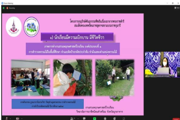
ภาพที่ 3 นำเสนอด้านที่ 2 การดำเนินงาน และด้านที่ 3 ผลการดำเนินงาน ครู-อาจารย์วิทยาลัยการอาชีพนิคมคำสร้อย