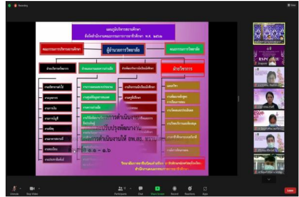
ภาพที่ 2 นำเสนอด้านที่ 1 การบริหารและการจัดการ ผู้อำนวยการวิทยาลัยการอาชีพนิคมคำสร้อย