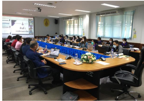
ภาพที่ 2 นำเสนอด้านที่ 1 การบริหารและการจัดการ ผู้อำนวยการโรงเรียนเจริญศิลป์ศึกษา