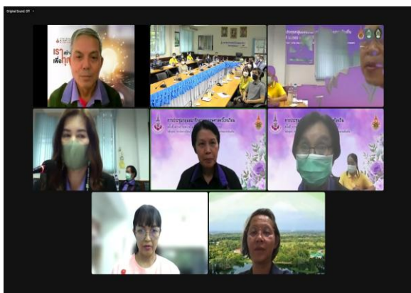
ภาพที่ 3 การนำเสนอด้านที่ 2 การดำเนินงาน และด้านที่ 3 ผลการดำเนินงาน ครูอาจารย์โรงเรียนเจริญศิลป์ศึกษา