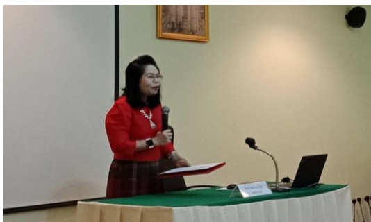
ภาพที่ ๑ รองอธิการบดี ม.ราชภัฏวไลยอลงกรณ์ฯ ร่วมพิธีเปิดการฝึกอบรมปฏิบัติการฯ

ศูนย์ประสานงานโครงการอนุรักษ์พันธุกรรมพืชอันเนื่องมาจากพระราชดำริฯ - มหาวิทยาลัยราชภัฏวไลยอลงกรณ์ฯ (อพ.สธ. - มรภ.วไลยอลงกรณ์ฯ) ได้จัดฝึกอบรมปฏิบัติการงานสวนพฤกษศาสตร์โรงเรียน หลักสูตร ๕ องค์กรประกอบ ระหว่างวันที่ ๑๘ - ๒๑ กุมภาพันธ์ พ.ศ.๒๕๖๓ ณ อาคารศูนย์ประสานงานโครงการอนุรักษ์พันธุกรรมพืชฯ ให้กับสมาชิกสวนพฤกษศาสตร์โรงเรียน กรุงเทพฯ จังหวัดปทุมธานี นนทบุรี นครปฐม สมุทรสาคร สมุทรปราการ สมุทรสงคราม โดยมีผู้เข้าร่วมการฝึกอบรม จำนวน ๒๘ แห่ง ๖๑ คน