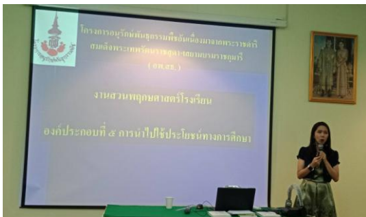
ภาพที่ ๓ วิทยากรศูนย์ประสานงานฯ บรรยายองค์ประกอบงานสวนพฤกษศาสตร์โรงเรียน