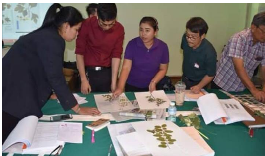
ภาพที่ ๕ การฝึกทำตัวอย่างพรรณไม้แห้ง