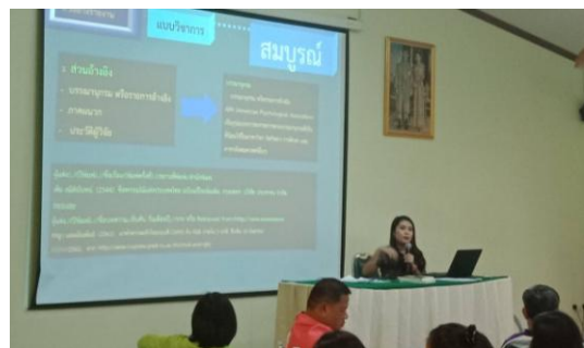
ภาพที่ ๒ วิทยากรศูนย์ประสานงานฯ บรรยายการดำเนินงานสวนพฤกษศาสตร์โรงเรียน