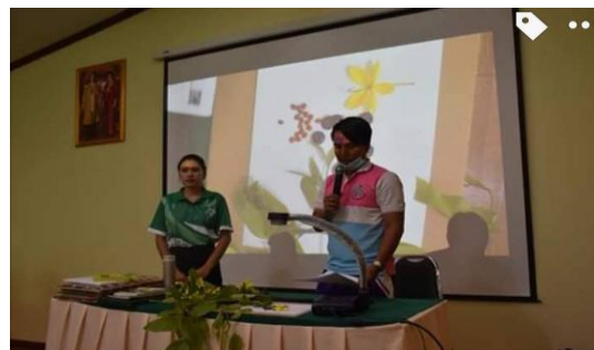
ภาพที่ ๔ นำเสนอผลปฏิบัติการกลุ่ม