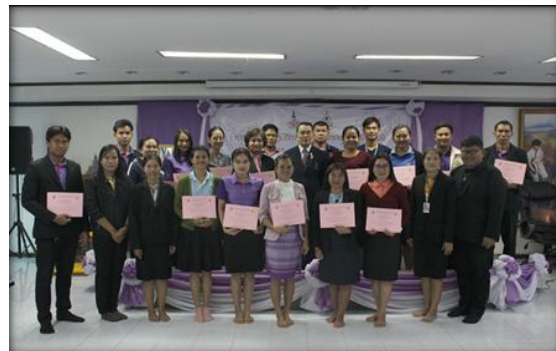
ภาพที่ 6 ผู้เข้ารับการฝึกอบรมฯบันทึกภาพร่วมกัน ในพิธีปิดการฝึกอบรมปฏิบัติการฯ