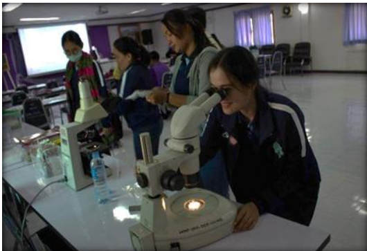
ภาพที่ 3 ผู้เข้ารับการฝึกอบรมฯ เรียนรู้การศึกษาโครงสร้างของพืชฯ