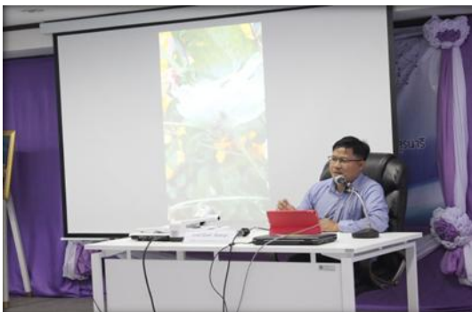
ภาพที่ 5 ผู้เข้ารับการฝึกอบรมฯ นำเสนอผลงาน