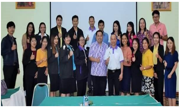
ภาพที่ 1 สมาชิกร่วมประชุมกลุ่มสมาชิก

ศูนย์ประสานงานโครงการอนุรักษ์พันธุกรรมพืชอันเนื่องมาจากพระราชดำริฯ มหาวิทยาลัยราชภัฏวไลยอลงกรณ์ฯ (อพ.สธ. - มรภ.วไลยอลงกรณ์ฯ) ได้จัดประชุมกลุ่มสมาชิกสวนพฤกษศาสตร์โรงเรียน หลักสูตรการบริหารและการจัดการ องค์ประกอบที่ 1 การจัดทำป้ายชื่อพรรณไม้ และองค์ประกอบที่ 2 การรวบรวมพรรณไม้เข้าปลูกในโรงเรียน ระหว่างวันที่ 23 - 24 ธันวาคม พ.ศ.2562 ณ ห้องประชุมศูนย์ประสานงาน อพ.สธ. - มหาวิทยาลัยราชภัฏวไลยอลงกรณ์ฯ อาคารศูนย์ประสานงานโครงการอนุรักษ์พันธุกรรมพืช ชั้น 2 ให้กับสมาชิกสวนพฤกษศาสตร์โรงเรียน กรุงเทพมหานคร ปทุมธานี นนทบุรี นครปฐม สมุทรสาคร สมุทรปราการ และสมุทรสงคราม โดยมีผู้เข้าร่วมการประชุมกลุ่มสมาชิกฯ จำนวน 13 แห่ง 25 คน