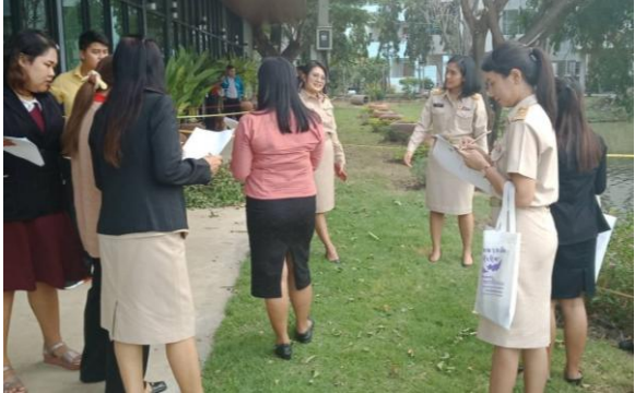
ภาพที่ 3 ปฏิบัติกลุ่ม การทำผังพรรณไม้