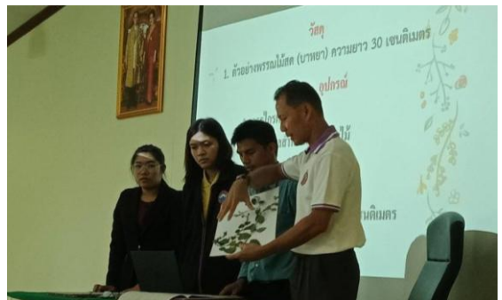
ภาพที่ 6 นำเสนอผลปฏิบัติการกลุ่ม