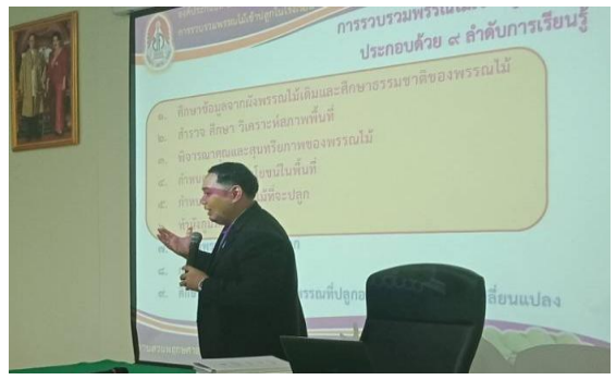
ภาพที่ 2 วิทยากรผู้ช่วย องค์ประกอบที่ 2