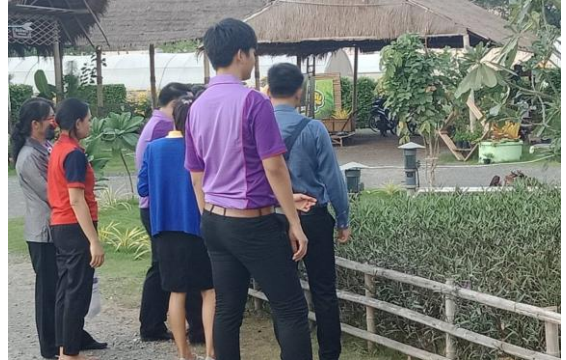
ภาพที่ 4 ปฏิบัติการกลุ่ม การสำรวจสภาพภูมิศาสตร์