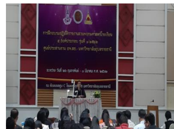
ภาพที่ 3 - 5 วิทยากร อพ.สธ. บรรยายแนวทางการดำเนินงานสวนพฤกษศาสตร์โรงเรียน