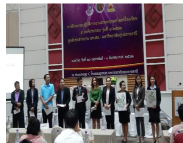
ภาพที่ 6 - 8 บรรยายภาคในการฝึกอบรมปฏิบัติการงานสวนพฤกษศาสตร์โรงเรียน 5 องค์กรประกอบ