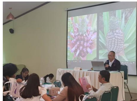
ภาพที่ 2 - 3 วิทยากร อพ.สธ. บรรยายแนวทางการดำเนินงานสวนพฤกษศาสตร์โรงเรียน