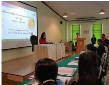
ภาพที่ 1 พิธีเปิดการฝึกอบรมปฏิบัติการงานสวนพฤกษศาสตร์โรงเรียน หลักสูตร 5 องค์กรประกอบ

ศูนย์ประสานงานโครงการอนุรักษ์พันธุกรรมพืชอันเนื่องมาจากพระราชดำริฯ มหาวิทยาลัยราชภัฏวไลยอลงกรณ์ในพระบรมราชูปถัมภ์ (อพ.สธ. – มรว.) จัดฝึกอบรมปฏิบัติการงานสวนพฤกษศาสตร์โรงเรียน หลักสูตร 5 องค์กรประกอบ ระหว่างวันที่ 5 - 8 กุมภาพันธ์ พ.ศ.2562 ณ อาคารศูนย์ประสานงานโครงการอนุรักษ์พันธุกรรมพืช ชั้น 2 มหาวิทยาลัยราชภัฏวไลยอลงกรณ์ในพระบรมราชูปถัมภ์ อำเภอคลองหลวง จังหวัดปทุมธานี ให้กับสมาชิกสวนพฤกษศาสตร์โรงเรียนในพื้นที่กรุงเทพมหานคร ปริมณฑล และหน่วยงานสนองพระราชดำริฯ โดยมีผู้เข้าร่วมการฝึกอบรมปฏิบัติการฯ จำนวน 20 แห่ง 65 คน